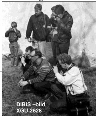
DiBiS -bild XGU 2528