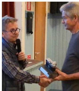
Resultatsiffrorna, som slutligen stannade på 70, 45, 50 och Kent fick ta hem LEICAN till Alfta-Edsbyn för ett år framåt. GRATIS till Alfta-Edsbyns Fk!