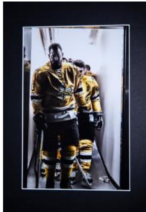
T.v. Kent Backebys bild "Våsbo". En 10-poängare som även fick juryns pris.

"Osannolikt vacker i väntan på tomten. Varm och inbjudande stämning som ger lugn och harmoni trots iskallt motiv".