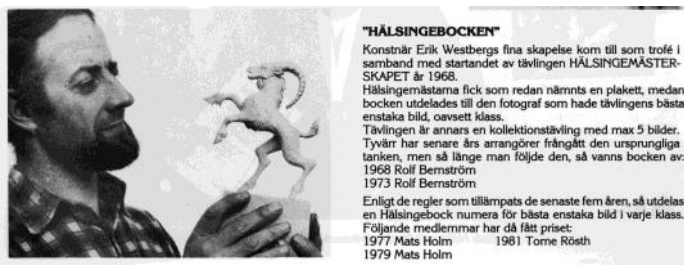
Ur Jubileums-Reflexen 1987

Årets Hälsingemästerskap arrangerades av Ljusdals Fk. 36 fotograf från landskapets 6 klubbar träffades i Slottegymnasiets lokaler. Där var påsiksbilderna uppsatta men juryn, som var elever på fotoprogrammet, höll sin bedömning, kort och koncist, utifrån projicerade bilder.