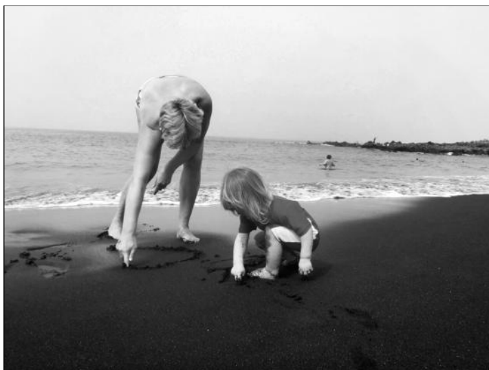
Hjärtan i sanden, FOTO: Marie Näslund.