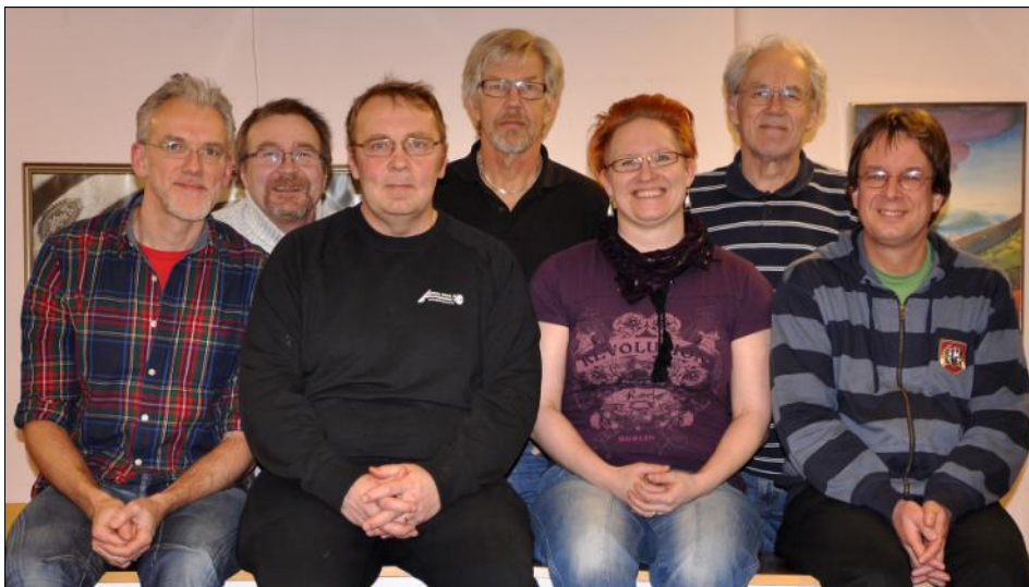
Söderhamns KK,s styrelse 2013