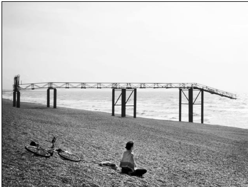
1:a placering Månadens bild januari 2013. se fler bilder från Månadens bild på sid 4 o. 5.

Medlemsblad för Söderhamns Kameraklubb Nr 2 februari 2013