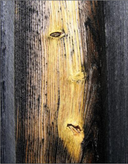
2:a plats i månadens bild. En solbränd brädvägg i Bonnstan i Skellefteå vid RIFO 2006.

V i var 24 st på årets första möte den sista januari. Det blev trångt kring borden och mycket fotosnack. Några nya som tänker bli med i klubben hälsades välkomna.