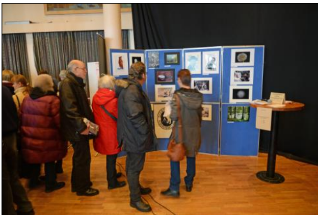
Många tittade på Kameraklubbens skärmar med bilder.

rullade dock på och många stannade upp för att kolla och prata. Syftet och tanken med bildspelet är att bilderna skall bli framtida värdefulla historiska dokument. Att printa ut ett urval, som sedan arkiveras, ligger för handen.