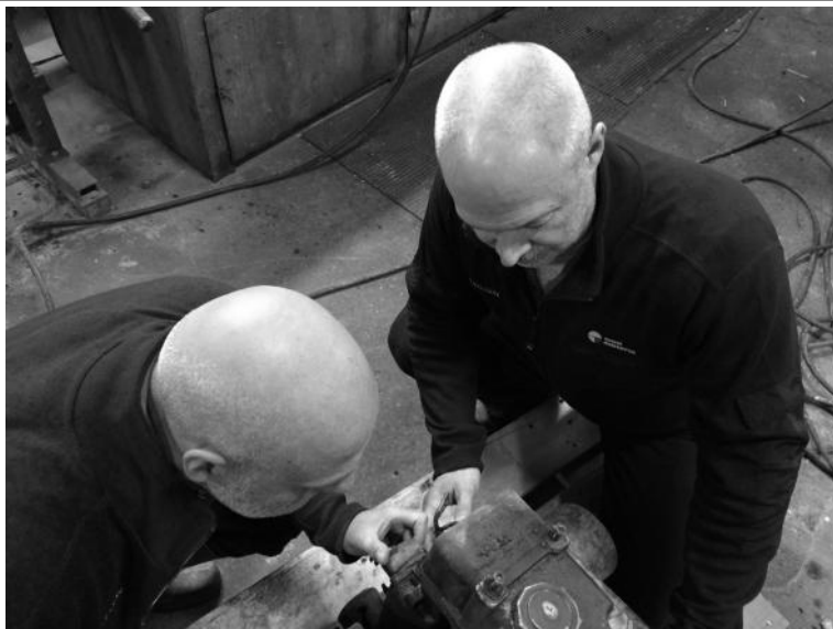
Segrarbilden i november "Månadens bild", tema "Avskalat". GRATTIS! Fler bilder sid 5.