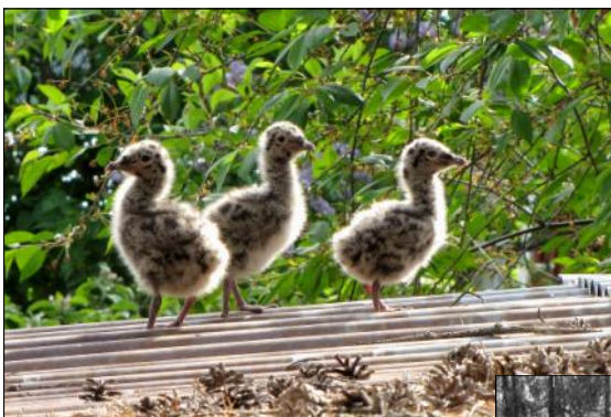
Ovan: 2:a plats.

Månadens bild hade ju temat "Tretal" och segrare blev Herman Claesson.