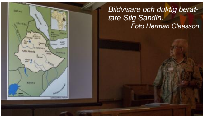
Bildvisare och duktig berättare Stig Sandin.