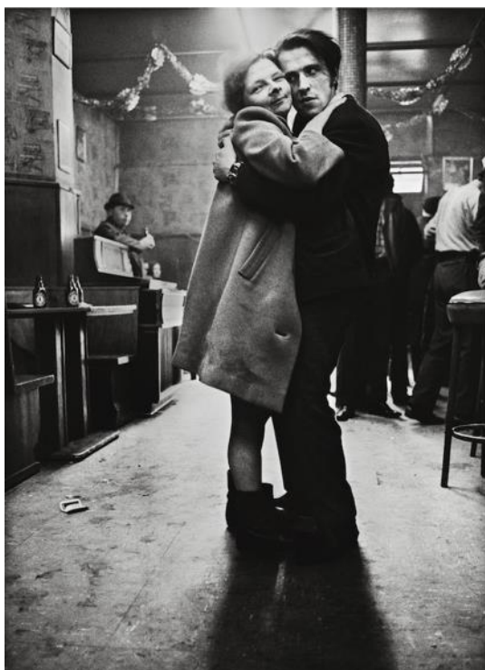
KLEINCHEN, HAMBURG 1970

"...det handlar om lusten att överraskas av det oförutsägbara och komma människor nära"