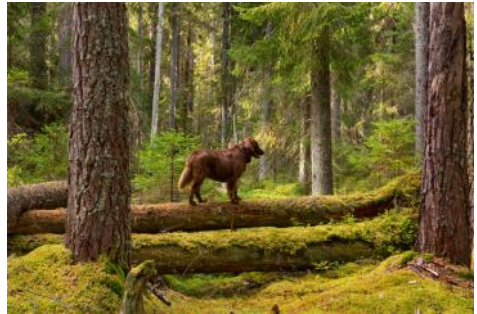
Anita Östlund , plats 2

tom att få samma röstpoäng så hade bilderna också exakt likadana röstplaceringar dvs hur många som röstat på bilderna som 1, 2 eller 3.