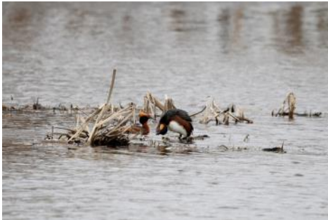
Christer Grehn delad 3:a

Det blev intressanta samtal kring bilderna, temat öppnade upp för olika tolkningar av "värdeskapande"; Något som höjer ett ekonomiskt värde, något som skapar ett ökat miljövärde eller något som skapar ett värde för fotografen genom möten med människor eller upple-