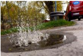
Lars' mystiska kaskad, en kokande källa eller vad ??