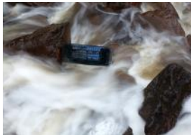
Anitas mystiska nedskräpning i forsen vid Kvarnen.