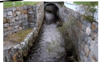
Sture såg en nyrenoverad mur på Väster. Inte lika skickligt gjord som den på Kalles bild.

Här några exempel på hur vi lyckades med uppgiften.